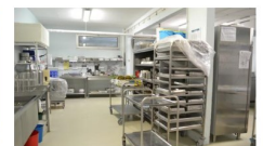
DES NOUVELLES CUISINES POUR LES RÉSIDENTS DE SEZANNE ET NOGENT SUR SEINE 11 / 05 / 2015

Les cuisines des sites de Nogent sur Seine et de Sézanne sont en train de subir de nombreuses transformations pour répondre aux normes alimentaires. Pour cela, les cuisines passent en liaison froide.